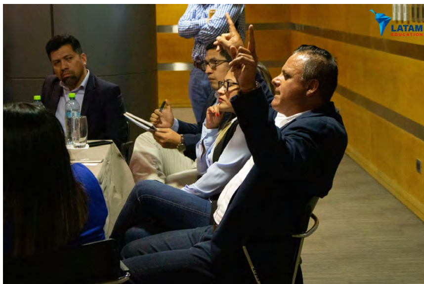
Cursos y conferencias de LATAM Education en 2019