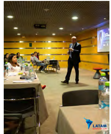
Cursos y conferencias de LATAM Education en 2019