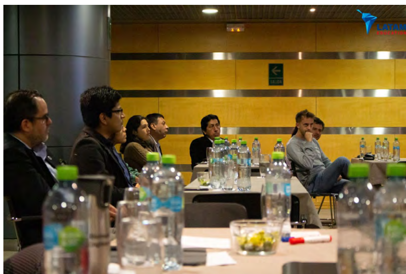
Cursos y conferencias de LATAM Education en 2019