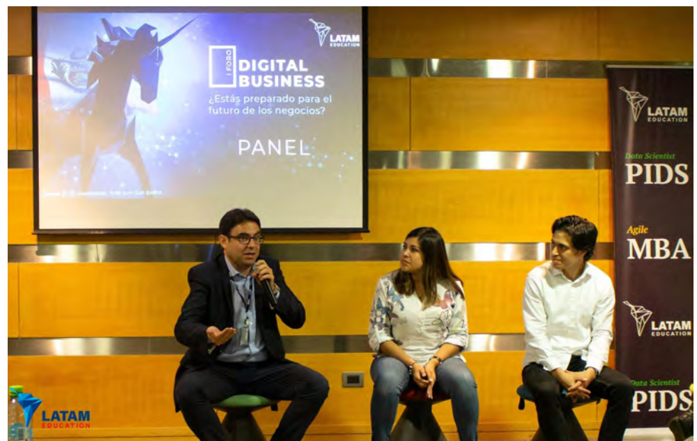
Cursos y conferencias de LATAM Education en 2019