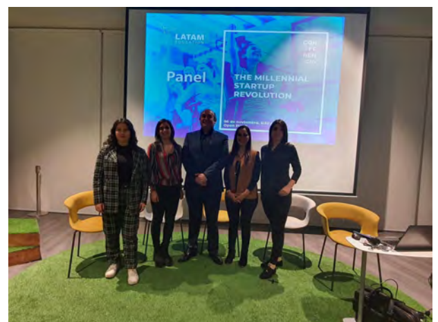
Millennials Startup Revolution de LATAM Education 6 de noviembre de 2019. Ver video