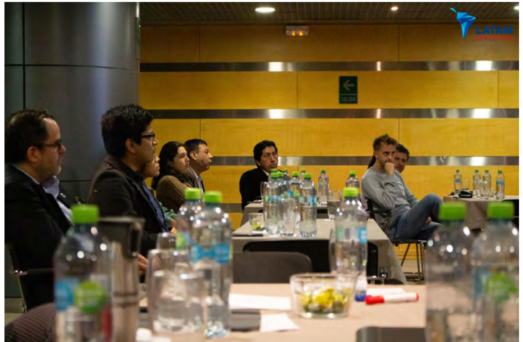
Cursos y conferencias de LATAM Education en 2019